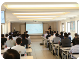
2022.09 新產品與技術發表會暨博覽會